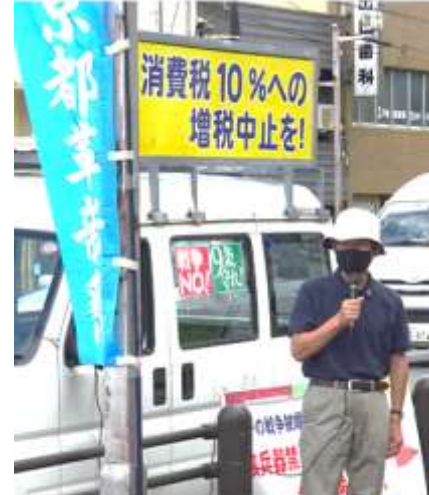
京都原水協 平事務局長