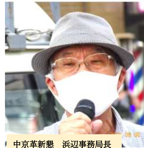
中京革新懇 浜辺事務局長